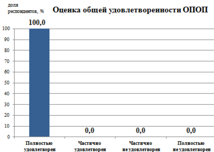
Рис.1 - Удовлетворенность обучающихся образовательной программой в целом

Оценка общих характеристик вуза, включающих инфраструктуру университета, социально-культурные и бытовые условия, репутационные характеристики вуза оценены респондентами высоко – средний балл 4,9 из 5 максимально возможных баллов. Опрошенные обучающиеся подтвердили, что готовы рекомендовать университет родственникам и знакомым для получения профессионального образования, в Университете созданы все необходимые бытовые условия (столовые, общежитие, медпункт, организация досуга и т.п.).