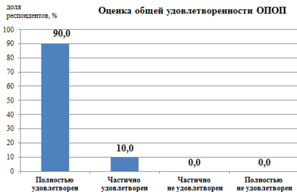
Рис.1 - Удовлетворенность обучающихся образовательной программой в целом

Оценка общих характеристик вуза, включающих инфраструктуру университета, социально-культурные и бытовые условия, репутационные характеристики вуза оценены респондентами достаточно высоко – средний балл 4,7 из 5 максимально возможных баллов. Опрошенные обучающиеся отметили, что информация о деятельности Университета открыта и доступна в социальных сетях и мессенджерах (VK, Telegramm и пр.).